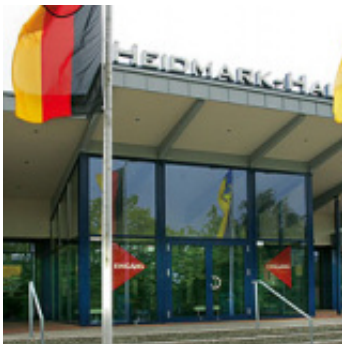
_ Heidmark Halle