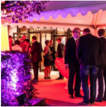
_ Neujahrsempfang der Stadt Walsrode